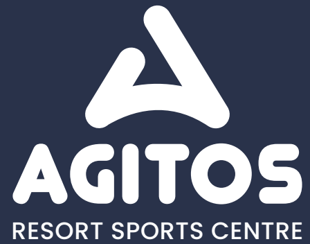
logotyp konstruovaný na výšku / barevné inverzní provedení