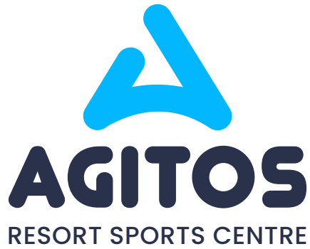
logotyp konstruovaný na výšku / barevné provedení