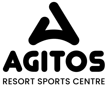
logotyp konstruovaný na výšku / barevné provedení