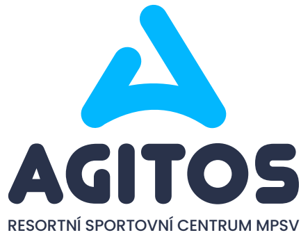
logotyp konstruovaný na výšku / barevné provedení