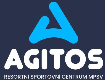
logotyp konstruovaný na výšku / barevné inverzní provedení