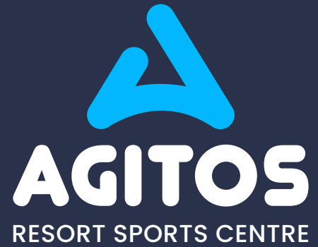
logotyp konstruovaný na výšku / barevné inverzní provedení