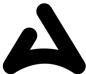
Agitos symbol / jednobarevné provedení